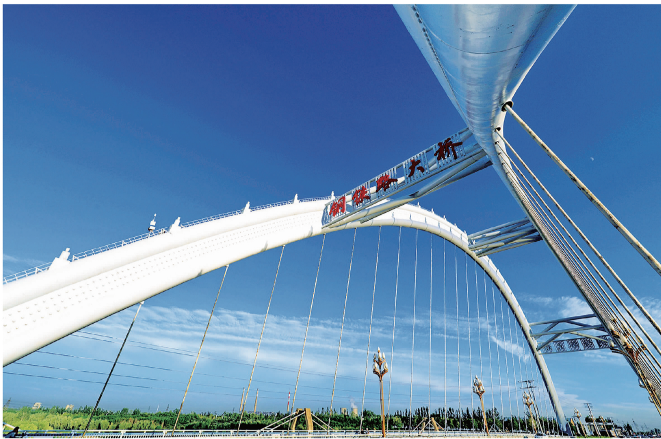
图为邢台市七里河钢铁大桥。

邢台市还有白马河大桥、七里河大桥……一座座桥四通八达，将邢台与世界联通，也与现代化联通。桥东桥西已成历史，而襄都信都又从历史深处走来。桥是一个物质实体，又往往被人们赋予精神属性。从此岸到达彼岸，不断地跨越，不断地丰盈。邢台于我，又何尝不是一座通往诗与远方的人生之桥呢？