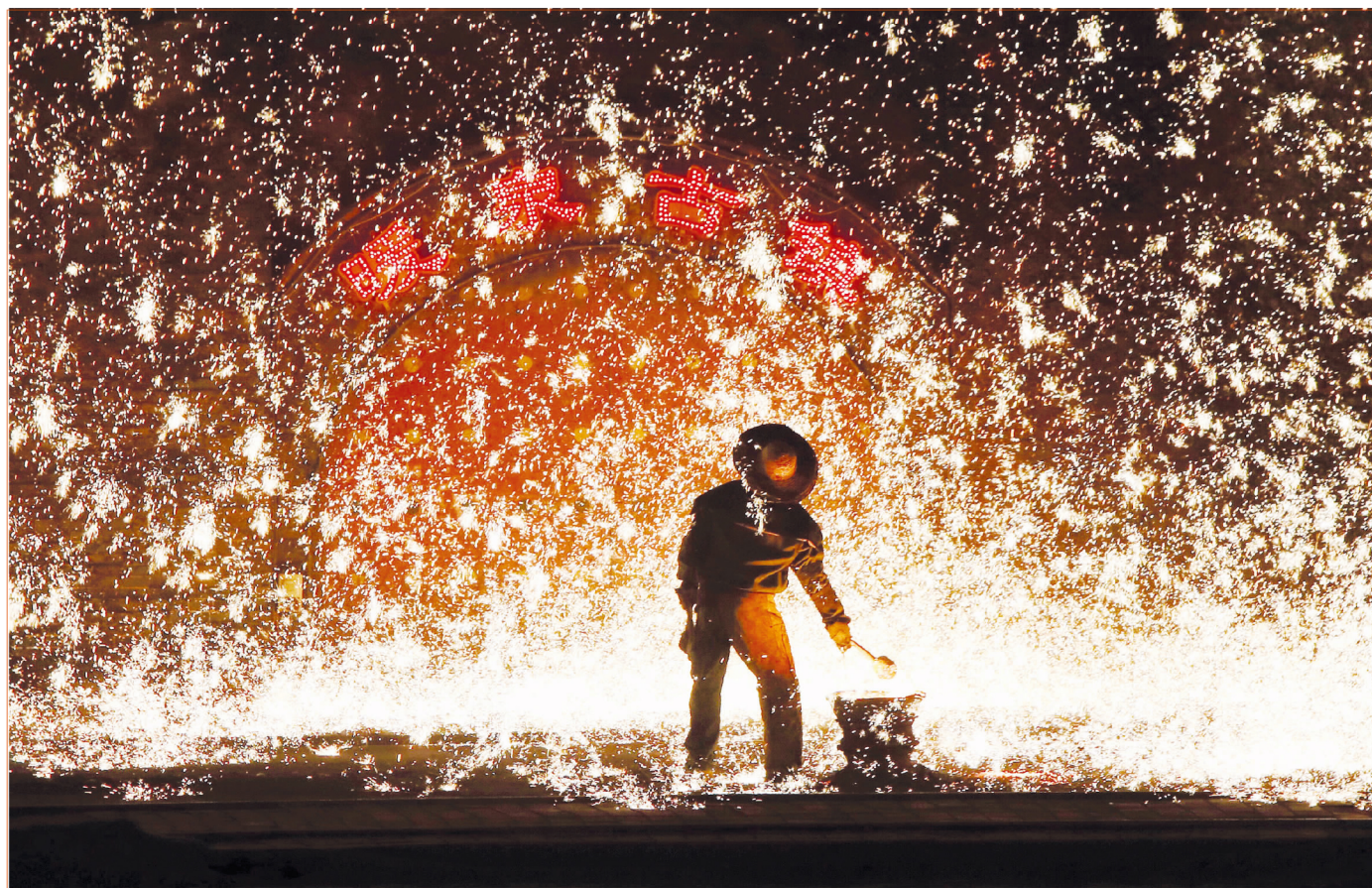
梦里蔚州不思归,树花烟火暖泉飞