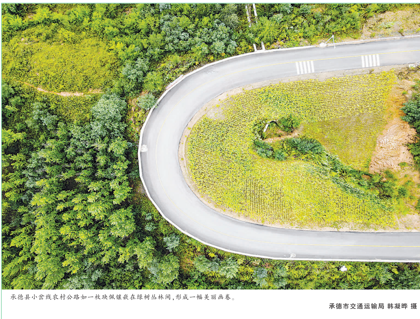
承德县小岔线农村公路如一块块镶嵌在绿林丛林间,形成一幅美丽画卷。