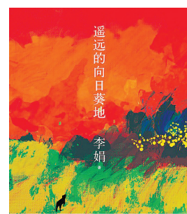
2018 第七届“鲁迅文学奖”获奖作品 2017 年度“中国好书” 李娟 著 李娟 著 李娟 著 李娟 著 李娟 著

“向日葵地”在阿勒泰戈壁草原的乌伦古河南岸，是李娟母亲多年前承包耕种的一片贫瘠土地。李娟一如既往地细腻、明亮的笔调，记录了劳作在这里的人和他们朴素而迥异的生活细节，刻画的不只是母亲和边地人民的坚韧辛劳，更是他们内心的期望与执着，也表达了对环境的担忧和对生存的疑虑，呈现出一种完全暴露在大自然中脆弱微妙的，同时又富于乐趣和尊严的生存体验。