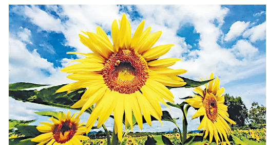
本版编辑：王冉冉 杜楠