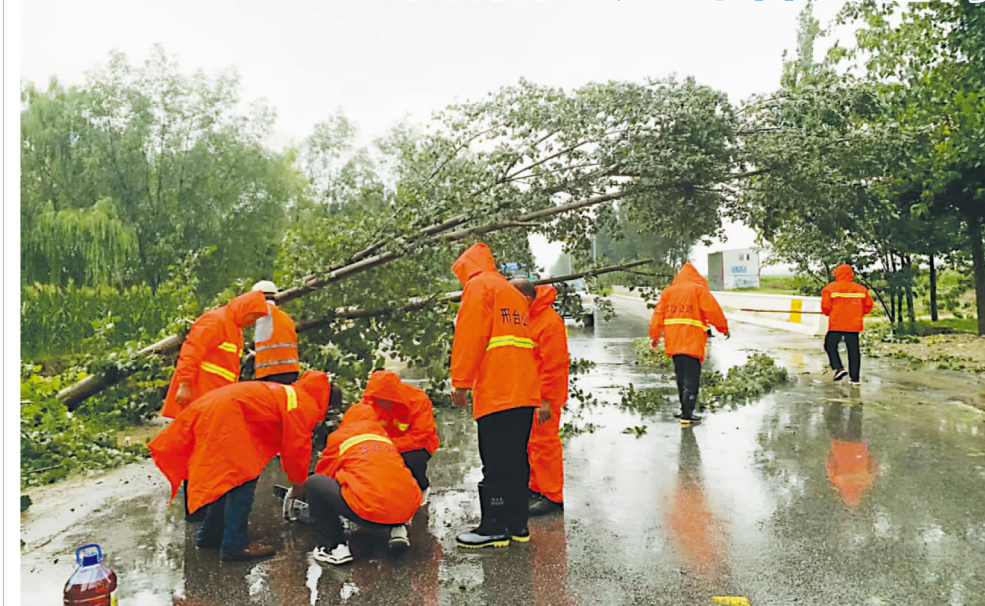
邢台市公路建设养护中心一线养路工清理倒伏路树