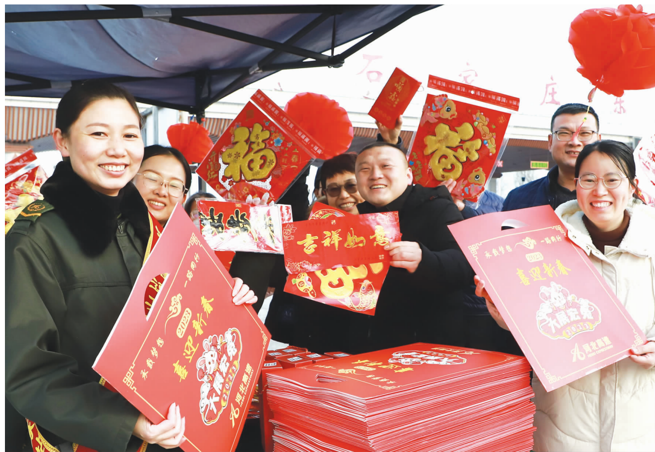
在石安高速石家庄东收费站,收费员正为过往司乘发放福字、对联。