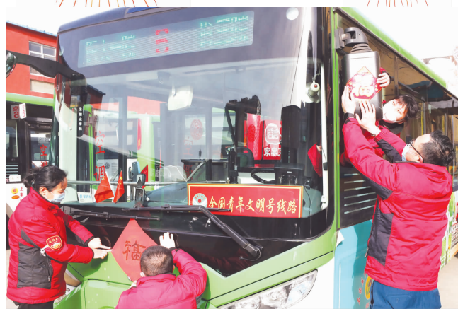
在石家庄市公交集团五公司,6路车队几名车长正在装扮公交车,营造过节气氛。