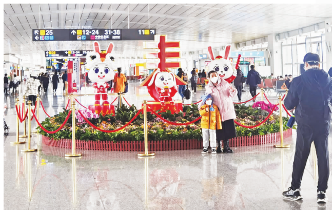
石家庄机场,出行的旅客在新春装饰前拍照留念。