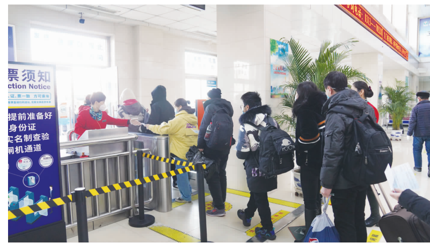
在张家口怀来县沙城汽车客运站,乘客正在有序检票进站。