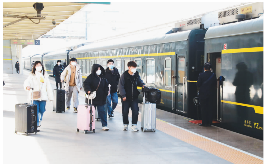
在邯郸火车站,乘客们正准备上车。