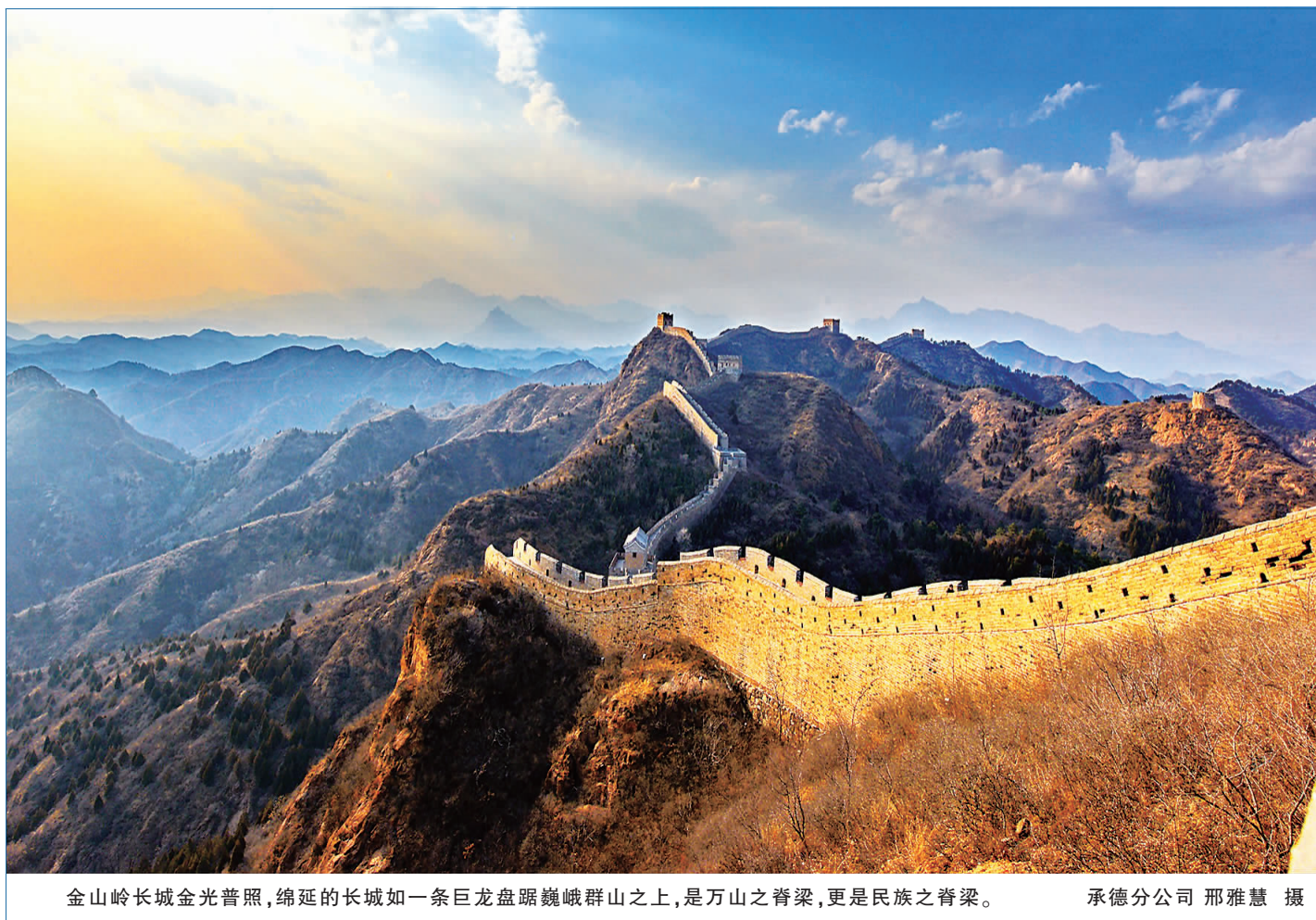
金山岭长城金光普照,绵延的长城如一条巨龙盘踞巍峨群山之上,是万山之脊梁,更是民族之脊梁。