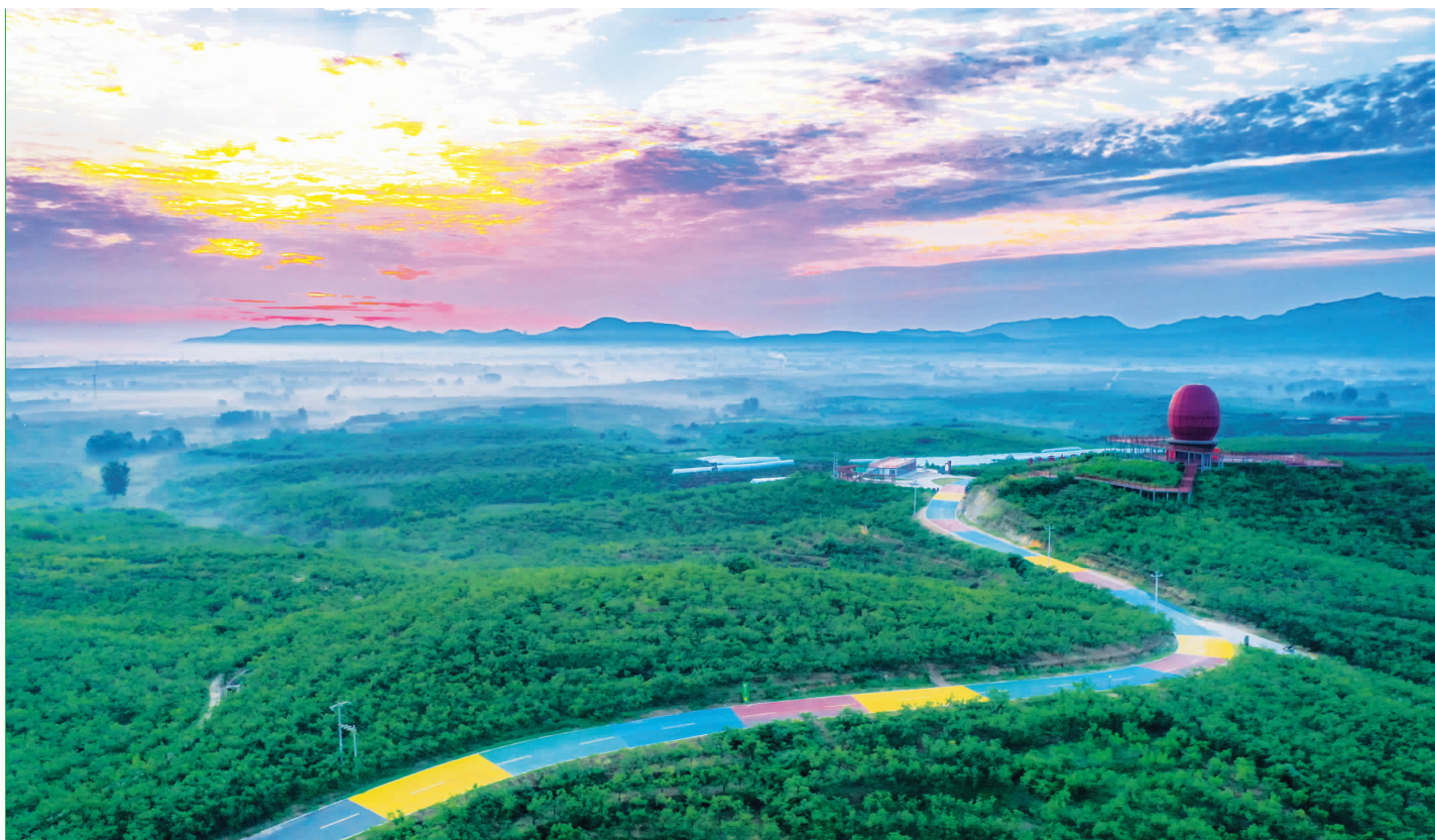
“大枣之乡”石家庄市赞皇县万亩枣园,彩色公路在枣园中伸展延绵,带来富足与希望。

北屋的窗台前是几年前婆婆栽种的两株石榴树,枝条上红色的嫩芽已全面伸展开来,蓄势吐放着红色花苞,偌大的树冠犹如两把绿色的大伞,给老屋带来恰到好处的荫