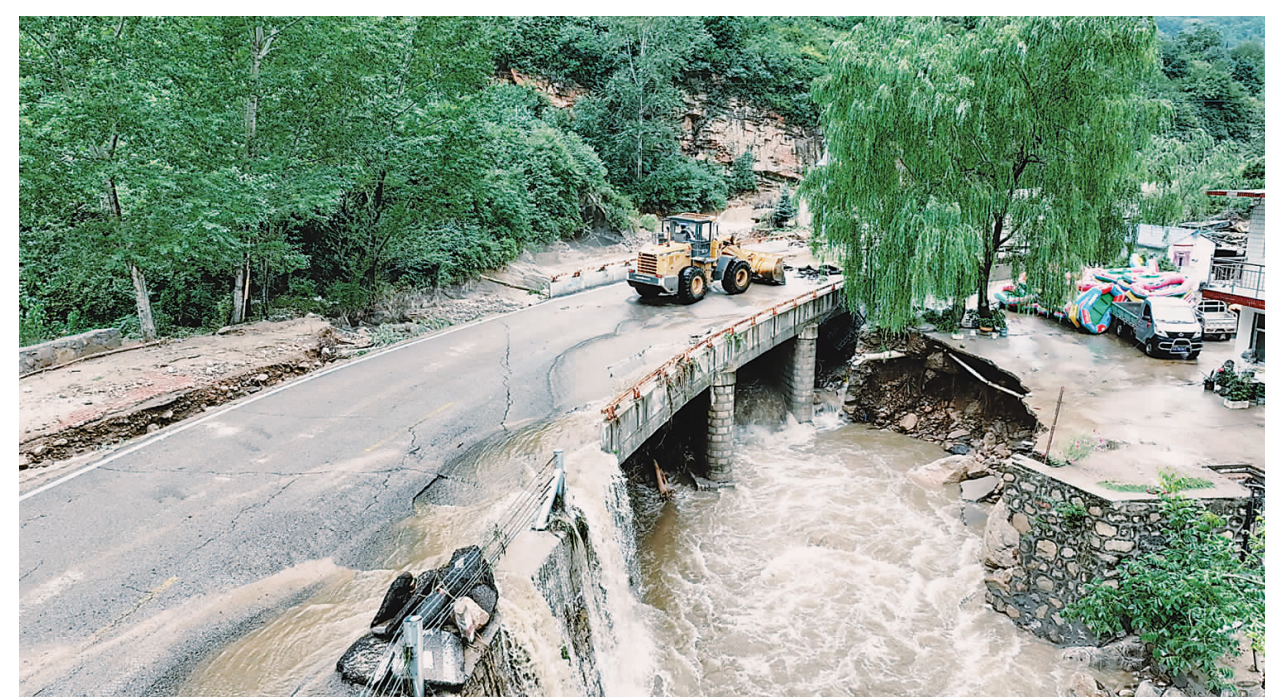
石家庄平山县交通运输局工作人员在平山正南线木厂村附近清理塌方及倒伏树木。

本版编辑:王冉冉