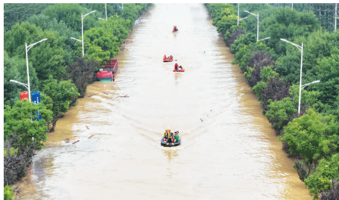
涿州市交通运输部门调集全市运输装备资源赶赴蓄滞洪区,开展灾民转移工作。