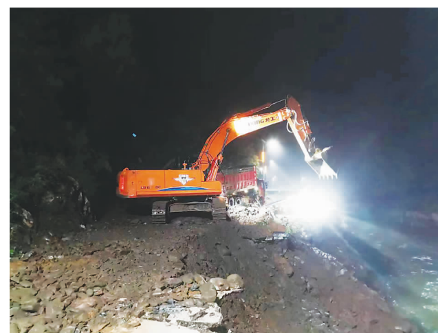
石家庄赞皇县交通运输局公路服务保障中心工作人员正在省道S543马嶂线抢通水毁路段。

本版编辑:王冉冉