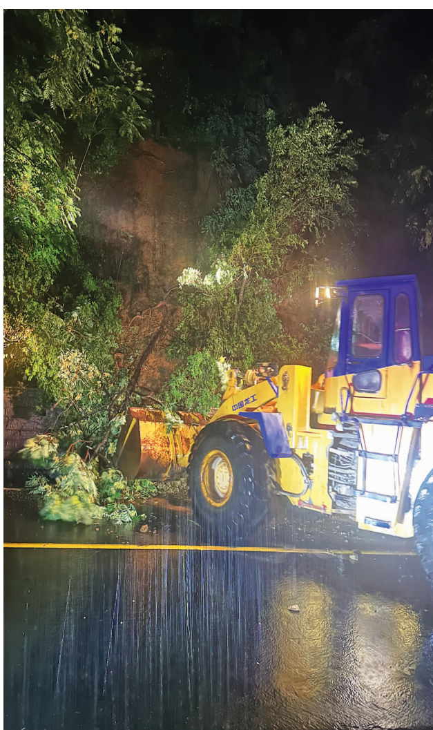
保定市交通运输局工作人员正在清理路面塌方。