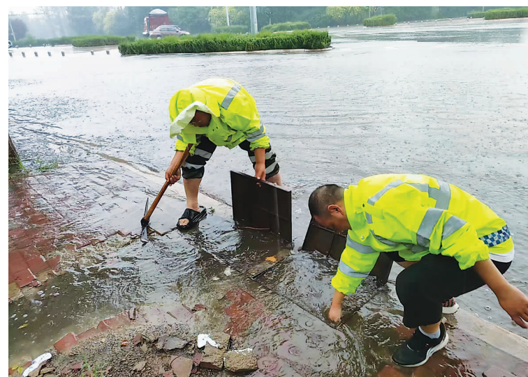
邯郸峰峰矿区交通运输公路执法人员正在清理排水口淤积堵塞杂物。