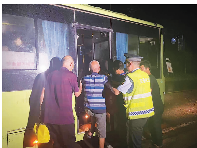
邯郸鸡泽县交通运输局迅速出动防汛抢险应急人员和转运车辆,连夜将群众转移至安置点。