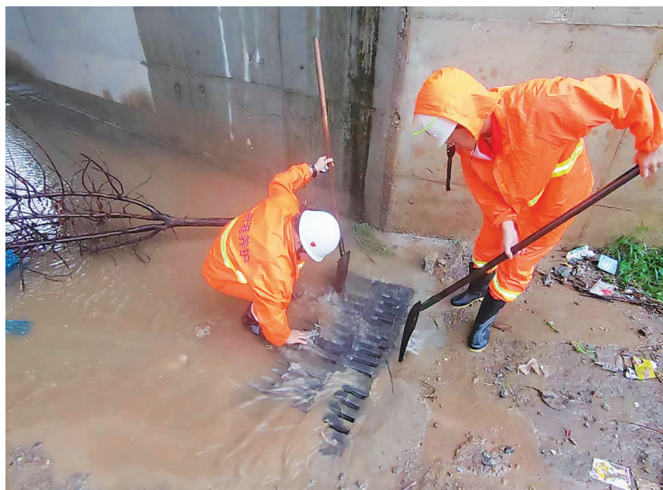
曲港高速养护人员正在疏通涵洞积水。