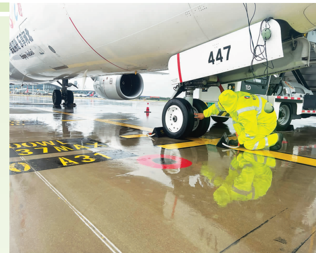
暴雨中,石家庄机场机务工作人员绕机检查航空器,确保飞机处于适航状态。