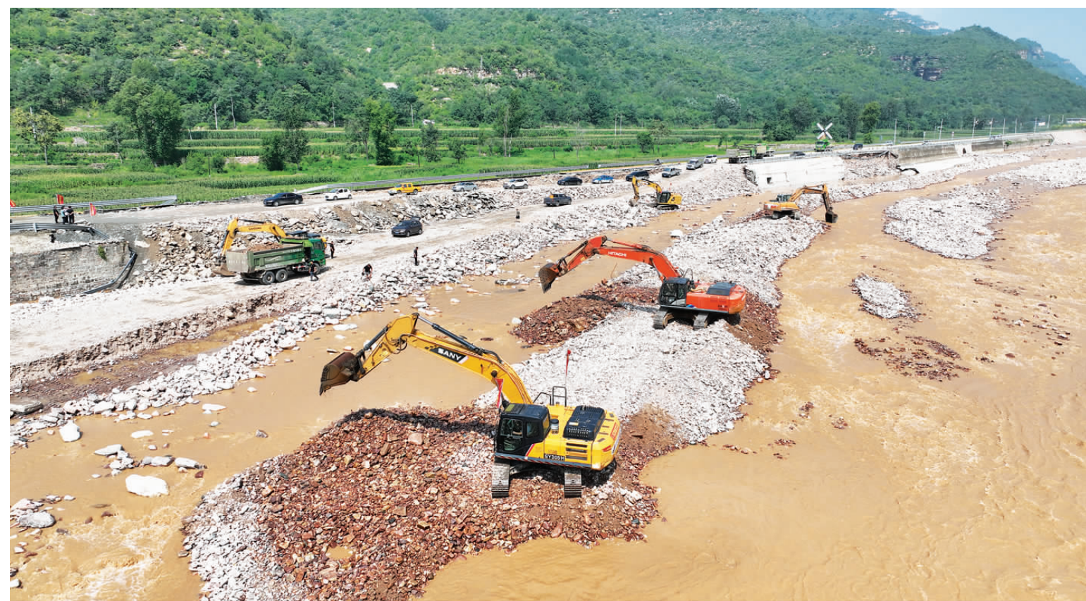
武安市交通运输局出动30多台施工车辆,抢通国道G234兴阳公路(武安市平安大道)。截至8月1日5时,该路所有水毁路段已全部恢复通车。