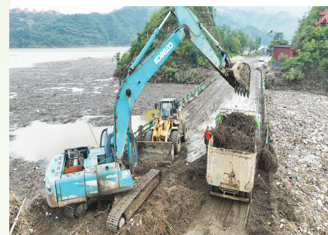
邢台信都区邢和线野河桥上,养护人员正在紧张作业,两台挖掘机进行路面清障。