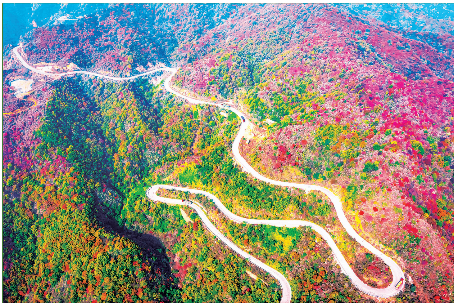
深秋时节,太行山层林尽染、万山红遍,穿行其中的太行天路,如一条玉带蜿蜒在群山间,美不胜收。