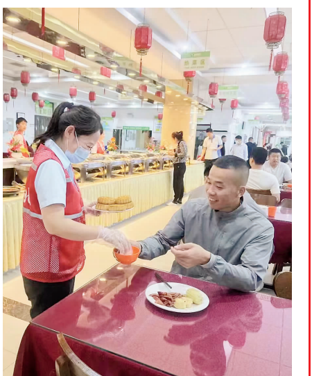
9 月 29 日,京港澳高速徐水服务区为司乘免费送月饼。

“冀交万里行”平台走进保定、曹妃甸、雄安北、徐水等服务区,向广大司乘介绍特色美食和充电桩配备、加油站运营等情况。同时,利用微信公众号每日发布天气、路况等情况,方便司乘出行。 温馨有序 提升服务品质 为进一步改善环境,擦亮窗口,提升服务,省禄发集团所属各服务区于节前对