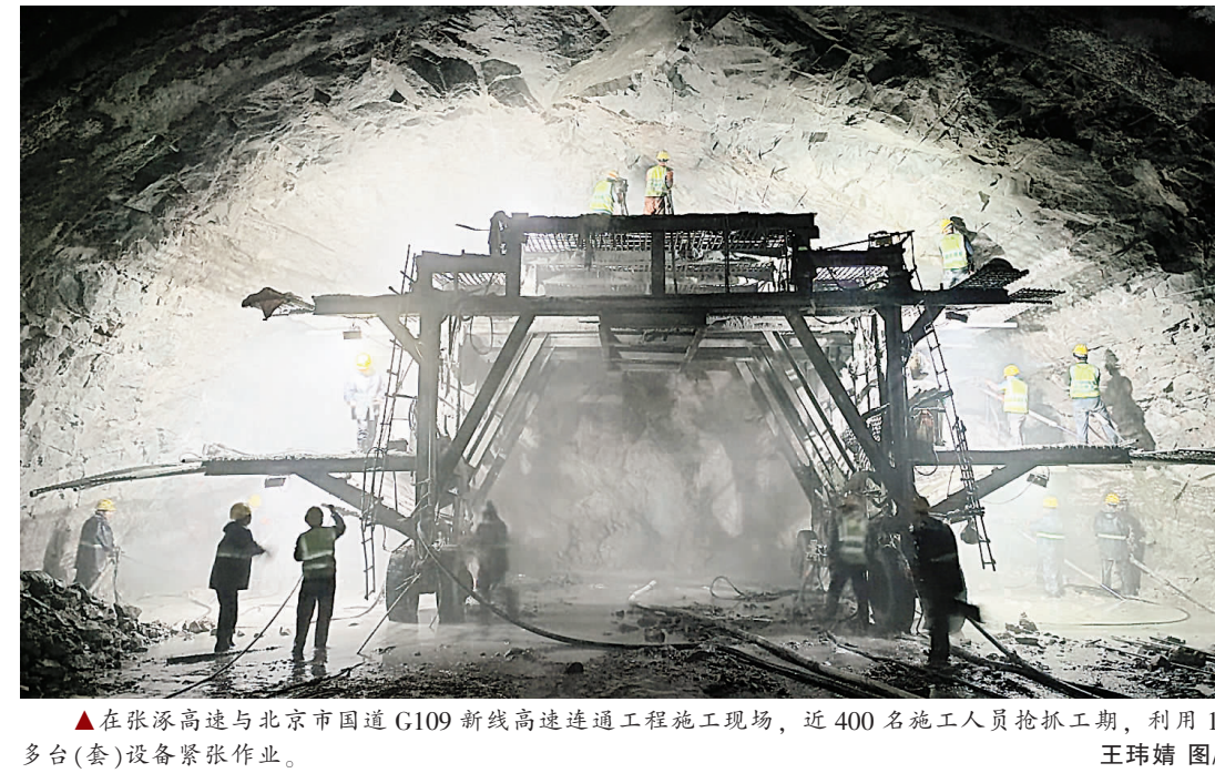
▲在张涿高速与北京市国道 G109 新线高速互通工程施工现场,近 400 名施工人員抢抓工期,利用 150 多台(套)设备紧张作业。