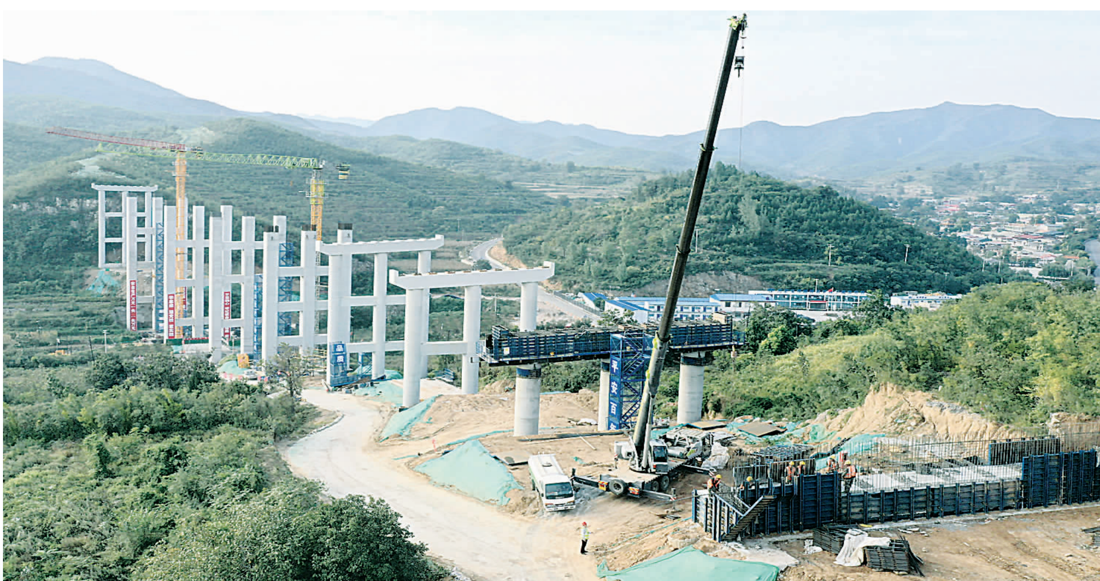
▲中秋国庆假期,2800 余名石太高速改扩建项目建设者坚守一线,抢工期、赶进度。目前,该项目已完成投资 24.59 亿元,占年度计划的 70.25%。