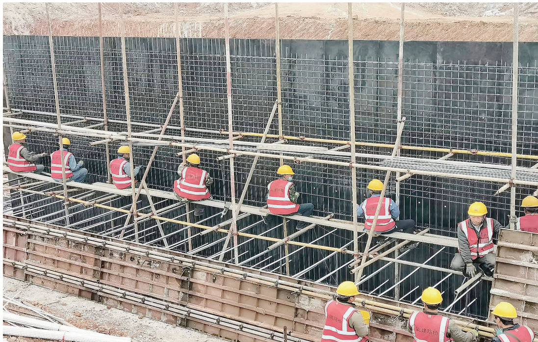
▲在密涿高速三河与平谷交界段及新增白庄子互通项目的建设现场,各班组施工人員坚守岗位,正紧锣密鼓进行施工。

为全力做好“双节”期间服务保障工作,省禄发集团进一步加强延伸服务工作力度,全面提升服务温度。各服务区为过往司乘免费提供开水、爱心药箱、简易修车工具、针线包等。同时,进一步加强值班值守,强化问询咨询功能,全力满足入区顾客的不同需求,不断增强过往司乘出行幸福感。