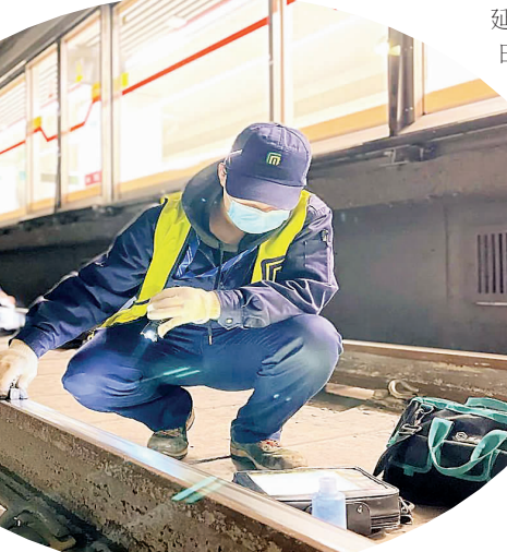
▲“双节”期间,石家庄地铁增派站务服务人员 233 人次,并积极与交通枢纽、商圈、大型活动场所提前联络,预测并共享客流数据,精准对接乘客需求,制定了客运组织“一站一预案”,细化服务举措。对重点车站重点盯控,对换乘通道及客流大的闸机、自动售票机等重点部位安排专人值守,引导乘客快速通行。同时,协同轨道交通公安、安保单位联合保障节日期间市民出行安全。

本报讯(通讯员李昆 田张梦)“双节”期间,石家庄地铁工作人员坚守岗位,通过增加高峰时段、延长运营时间、优化服务举措等一系列措施,全力保障乘客安全便捷出行。 9 月 28 日,石家庄地铁线网客运量 64.39 万人次,创线网单日客运量历史新高。10 月 6 日,线网客运量 61.42 万人次,创“双节”期间线网单日客运量新高。“双节”期间,线网客运量 372.63 万人次,创历年国庆假期客运量新高。 运输能力显著提升 为充分应对大客流挑战,满足不同时段乘客的出行需求,石家庄地铁在“双节”期间积极优化运输组织,延长全线网运营时间,提前部分线路运营时间,切实提高运营效率和效率。9 月 28 日,全线网提前