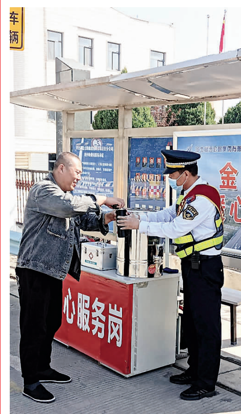
河北高速集团石安分公司为过往司机提供 24 小时便民延伸服务。

本报讯(通讯员魏好余)“双节”期间,河北高速集团石安分公司秉承“服务无止境”理念,圆满完成“双节”期间安全保畅任务。所辖路段收费站出入口车流量共计 301.9 万辆,日均 37.7 万辆,同比增长 117.5%,车流量最高峰为 9 月 29 日,达 40.39 万辆次,同比增长 118.2%,整体运行平稳有序。