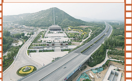
保定唐县京昆高速与乡村路构成快捷交通网