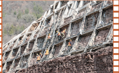
国道G106馆陶绕城段改扩建项目