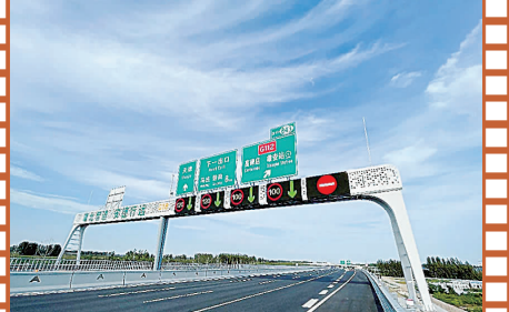
荣乌高速新线智慧龙门架