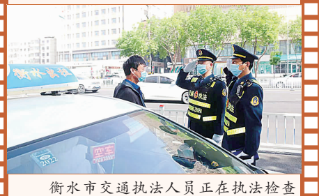
衡水市交通执法人员正在执法检查