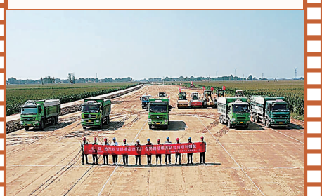
邢港高速施工现场