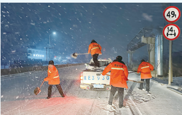
邢台市公路养护人员在那德线连夜除雪。