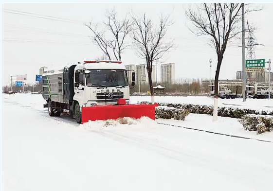
廊坊市交通部门清除国道G336文安县城东出口段积雪。