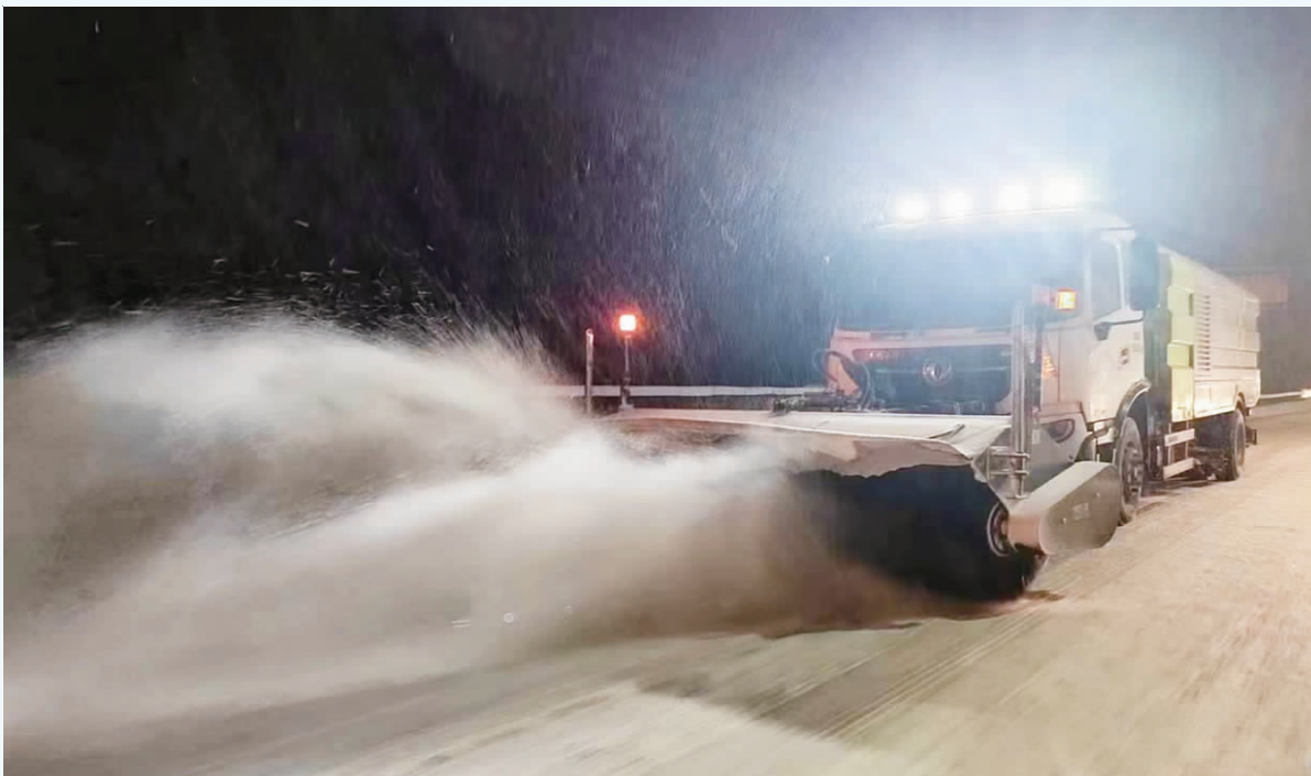
邯郸市交通部门连夜清除邯武快速路积雪。