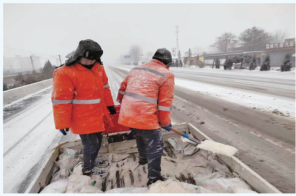
保定市公路养护人员正在撒布融雪剂。

2月20至21日，我省迎来大范围降雪，各地交通运输部门以雪为令，迅速行动，不间断进行除雪作业，全力以赴确保春运返程高峰期公路畅通。