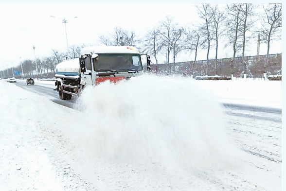
定州市交通部门在国道G107北段除雪。