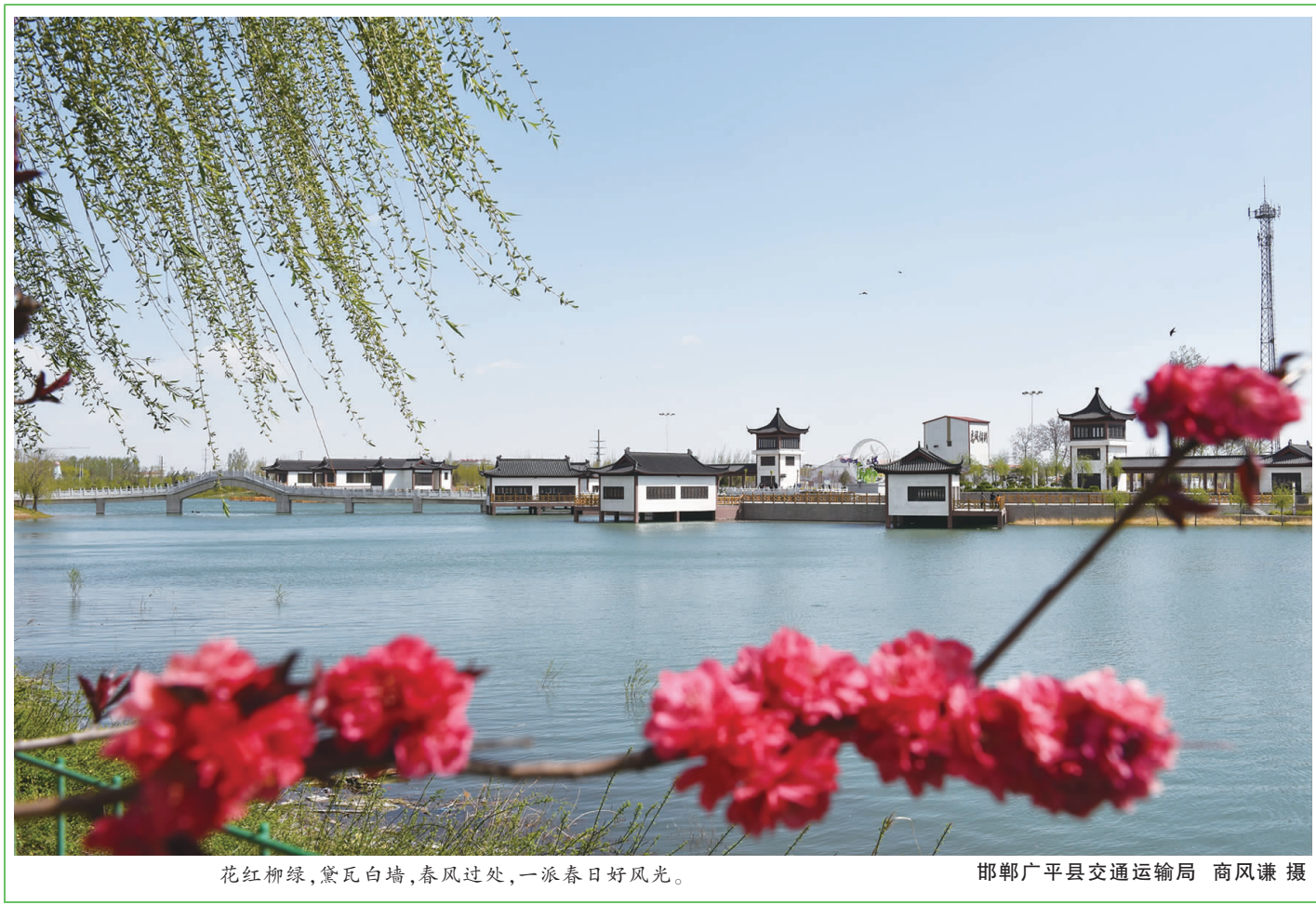
花红柳绿，黛瓦白墙，春风过处，一派春日好风光。