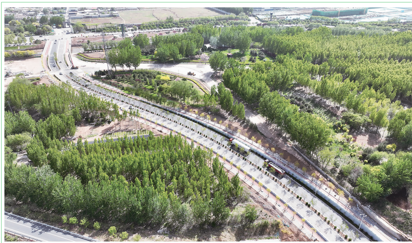
春意盎然，改造后的石家庄市鹿泉区花东街如一条穿林玉带，将这片绿意通向更远的地方。