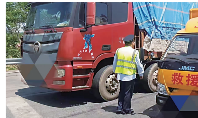
沧州东收费站工作人员热心帮助受困货车司机。

5月2日上午，一辆四轴货车在驶入沧州东收费站出口时意外爆胎，司机在突如其来的困境中感到手足无措。石黄分公司沧州东收费站的工作人员及时伸出援手，让这位司机感受到了高速公路上的小温暖。