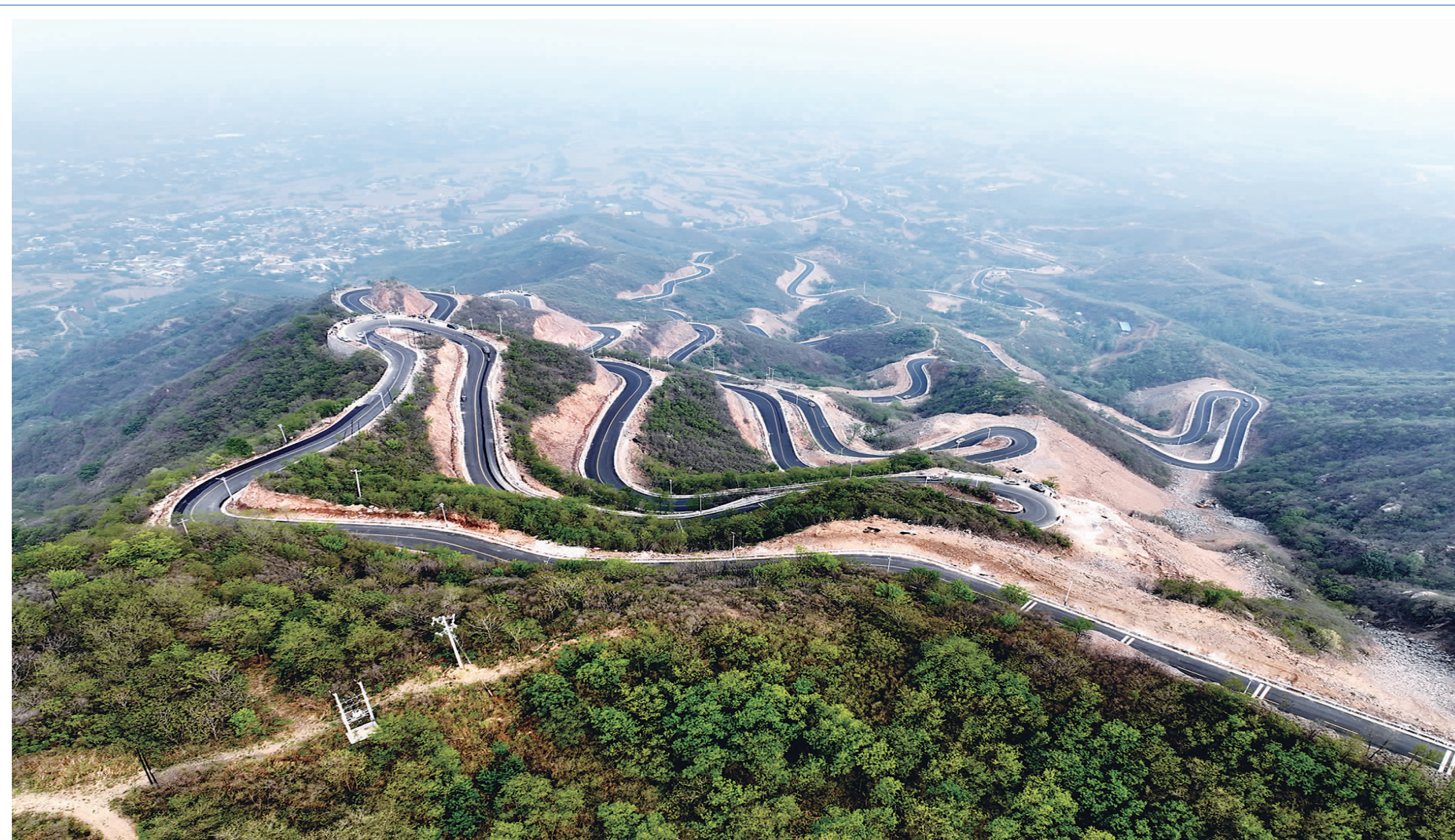
云中天路七十二拐——石家庄市元氏县县道 X061 元大线，道路蜿蜒延伸，如游龙盘卧。