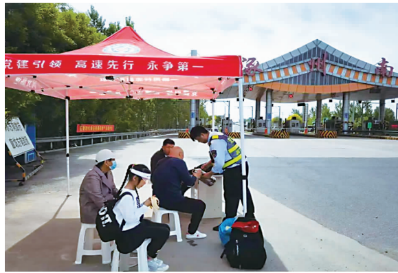
涿州南收费站为路过行人提供暖心服务。

安心等待家属的到来。这一简单而温馨的举动，让司乘们感受到了收费站员工的关怀与温暖。其中一位老人感慨地说：“你们想得真周到，要不是你们，我们还得在太阳底下站着呢，谢谢你们！”工作人员则摆摆手回应道：“不用谢，对我们的服务满意就是对我们最大的认可。祝您和家人旅途愉快！”(周冬竹)