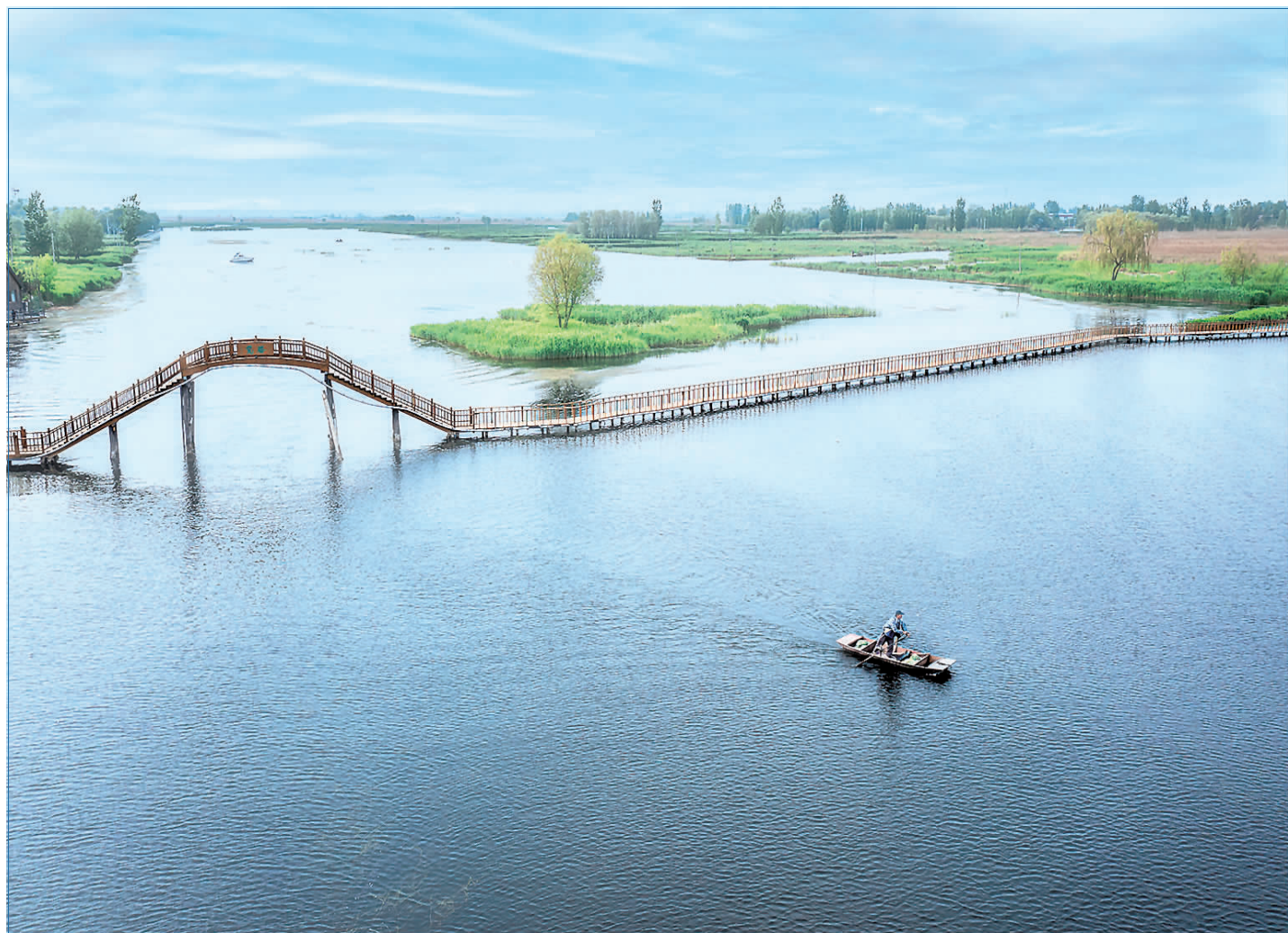
汪洋浩瀚、势连天际的白洋淀,给人一派萧然意远、旷达恬静之感。

但,也许你并不知道 温暖就在每个人的心中 人间从不缺少温暖 只需要你用温暖的心去看 你就会发现,温暖就在身边 一句谢谢,一声您好 一次赞美,一个微笑 …… 只要心存温暖,就会发现生活的美好 唯有传递温暖,才会让大爱行走人间 (作者系京石公司望都收费站安保员)