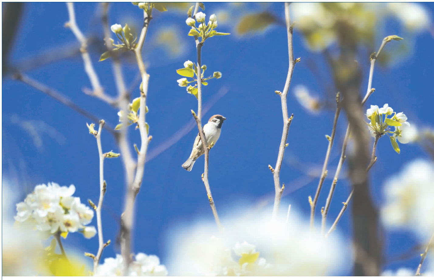
春风枝头鸟语催,晓风暖颊燕春回。

人生如梦,岁月如歌。伴随着时代发展,我也成为了交通战线上的一名老兵,修路、养路、管路,写路、赞路、颂路,成了我生活的主题。热爱交通、奉献交通,记录交通、赞美交通,为交通歌唱。