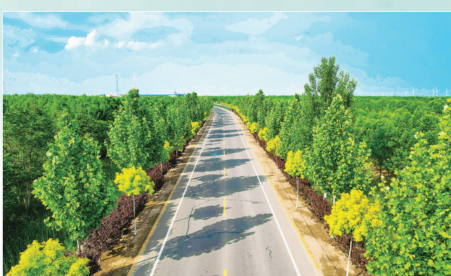
沧州市海兴县汤孔公路。