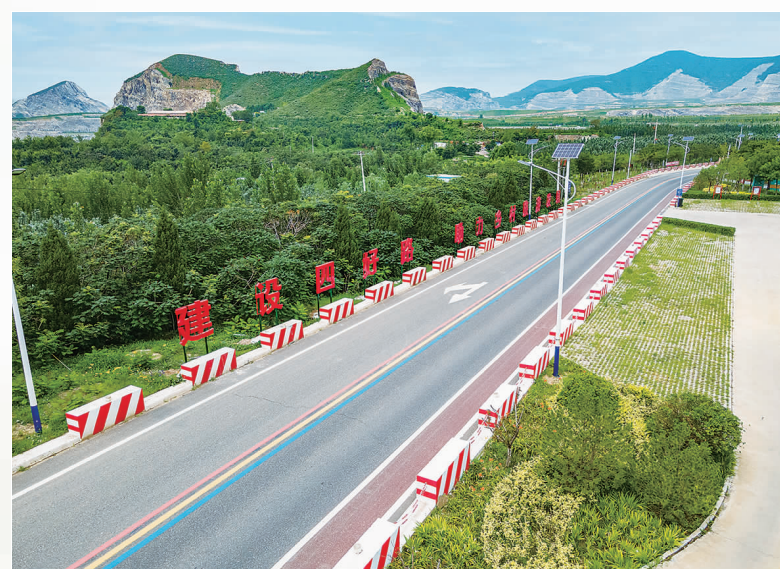
廊坊市三河市蒋渠线。

曾经,梦想着走出大山,看看山外的世界;曾经,梦想着回家的道路平坦而通畅……如今,梦想已经成真,天堑已成通途。