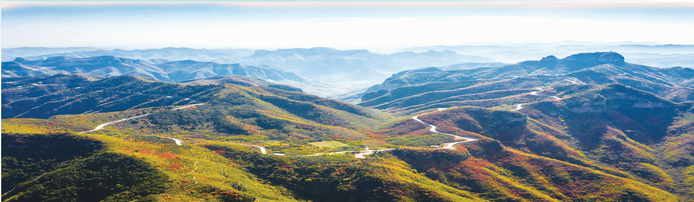
邯郸市磁县慈兴大道。