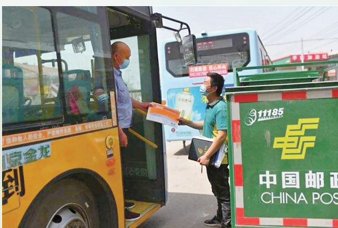
邯郸武安市交邮融合发展,公交快递进乡村。