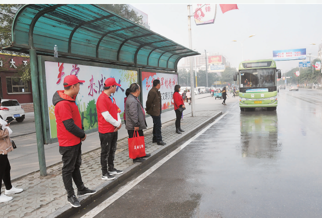
邢台沙河城区通往山区的公交车,让村民出行更便利。