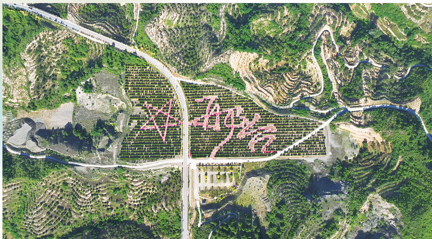
邢台市信都区抗大路。