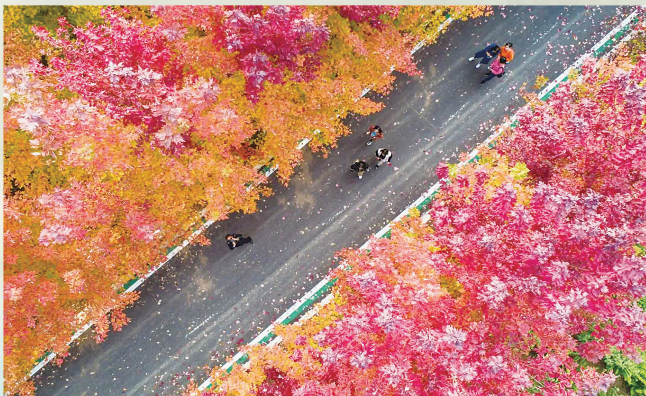
邯郸峰峰矿区农村路与万亩秀林相映成趣。