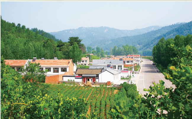
承德平泉市柳溪旅游路。